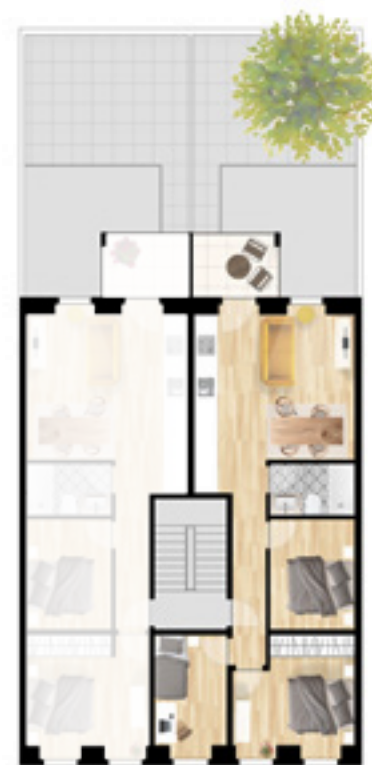
T2 + 1

Tipologia Property type apartamento 66 m 2 + varanda 66 m 2 apartment + balcony