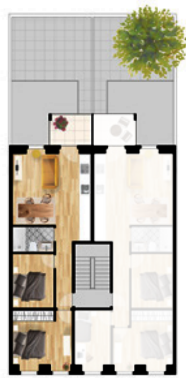
T1 + 1

Tipologia Property type apartamento 66 m 2 + varanda 66 m 2 apartment + balcony